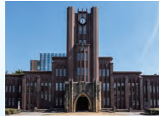
※難関大…東京科学大、一橋大、東京外国語大、旧帝大、早慶上理基とします。