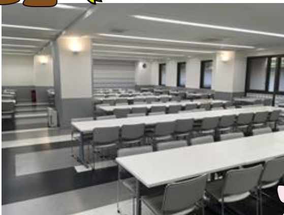
【休憩所】1号館 1階 カフェテリア